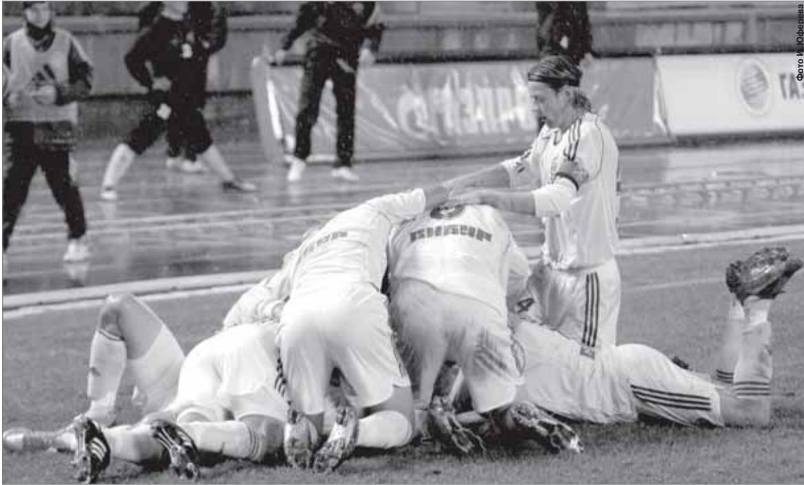
Только что был забит победный гол

получались опасными, но три угловых подряд краснодарцы подали. Неприятным получился и штрафной в исполнении Петкова – Чонтофальскому пришлось кулаком выбивать мяч из-под перекладины. Судовольствием применяли гости и трюк, направленный на то, чтобы не дать зенитовцам разбежаться. Любое игровое столкновение могло завершиться долгими «валяниями» пострадавшего. Шли в ход и тактические фолы. Однако в последние 15 минут тайма зенитовцы раз за разом стали разрывать оборону «Кубани». Увы, удачи в завершении комбинаций по-прежнему не хватало: штанга, Габулов и собственная