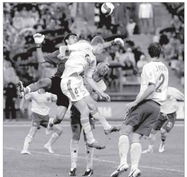
Борьба на «втором этаже»