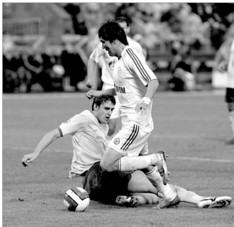
Прорыв Ким Дон Чжина